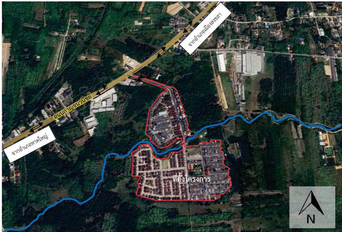
รูปที่ 1-1 ที่ตั้งโครงการและเส้นทางคมนาคม