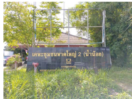
ป้ายชื่อโครงการ