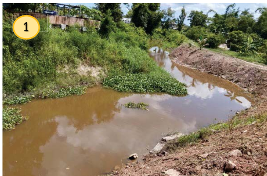
คลองวังลาน