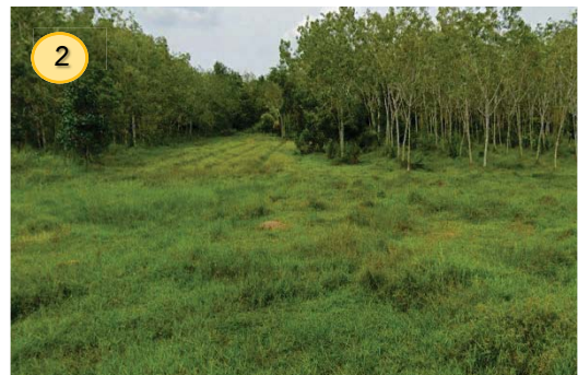
พื้นที่รกร้างรอการใช้ประโยชน์ด้านทิศใต้