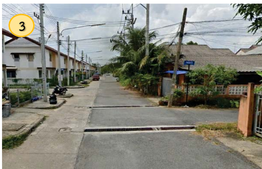
ถนนสายหลักของโครงการเคหะชุมชนขนาดใหญ่