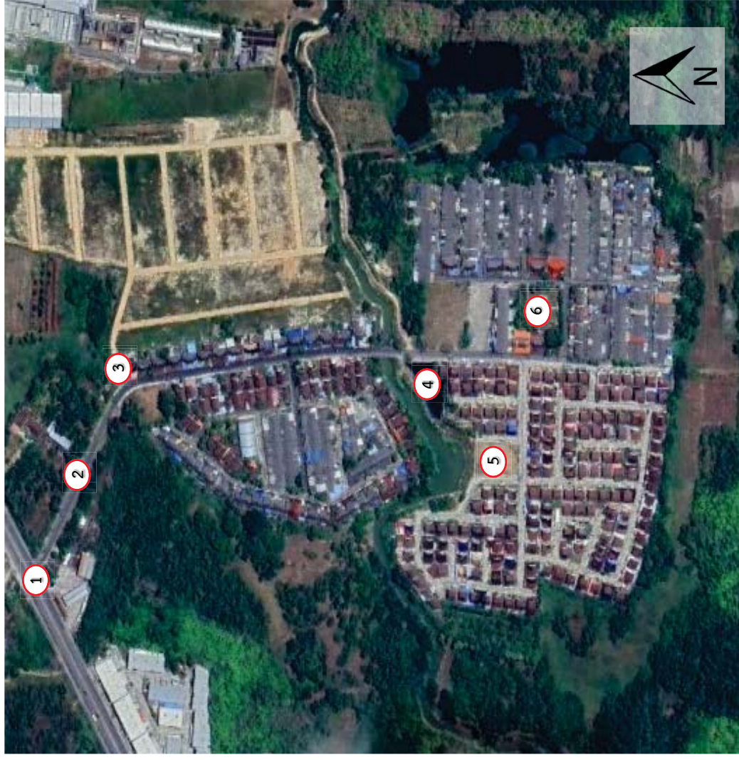
รูปที่ 1-3 ส่วนประกอบของโครงการ