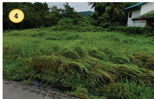
พื้นที่รกร้างรอการใช้ประโยชน์ด้านทิศตะวันตก